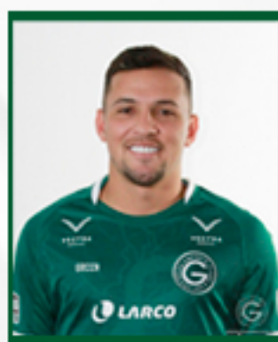
DADÁ B. 08/02/1997