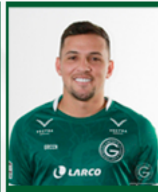
DADÁ B. 08/02/1997