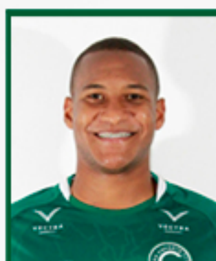
DA SILVA 07/02/2001